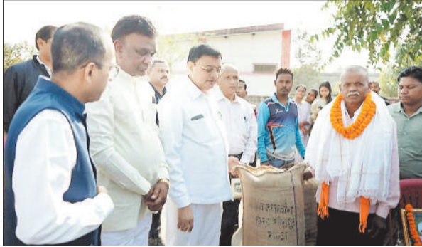
धान खरीदी का शुभारंभ करते उद्योग मंत्री लखनलाल देवांगन।

छत्तीसगढ़ सहकारी समिति कर्मचारी संघ के द्वारा पिछले दो सप्ताह से अपनी चार सूत्रीय मांग को लेकर हड़ताल पर चले जाने से जिले के 65 धान उपार्जन केंद्रों में धान खरीदी की प्रक्रिया ठप्प होती नजर आ रही है। लगभग 250 समिति कर्मचारी हड़ताल पर अडिग बने हुए हैं इससे निपटने के लिए शासन के निर्देश पर जिला प्रशासन ने ग्रामीण कृषि विस्तार अधिकारी और सहकारिता निरीक्षकों सहित फूड स्पेक्टर की इयूटी लगाई गई है ताकि इनके माध्यम से धान की खरीदी कराई जा सके लेकिन ये तीनों विभागों के अधिकारी भी धान खरीदी की शुरुआत करने समितियों में नहीं पहुंचे जिससे इन समितियों में सन्नाटा पसरा रहा। जबकि इसके पूर्व धान खरीदी शुरू होते ही उपार्जन केंद्रों में चहल पहल शुरू हो जाती थी।