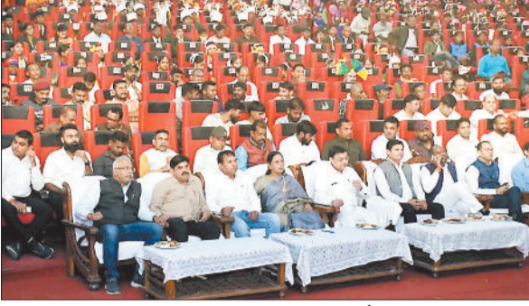
हरिभूमि न्यूज ►► कोरबा

केंद्र और राज्य सरकार जनजातीय समाज के शिक्षा, स्वास्थ्य, आजीविका, वनाधिकार तथा सांस्कृतिक संरक्षण के लिए निरंतर कार्य कर रही हैं। उन्होंने बताया कि जनजातीय क्षेत्रों में विकास की रफ्तार तेज हुई है और शासन यह सुनिश्चित कर रहा है कि योजनाओं का लाभ समाज के प्रत्येक व्यक्ति तक सरलता से पहुंचे।