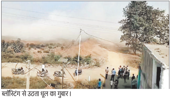
ब्लॉस्टिंग से उड़ता धूल का गुबार।

महज 100-200 मीटर की दूरी पर हैवी ब्लास्टिंग किया जा रहा है, ब्लास्टिंग की तीव्रता इतनी ज्यादा थी कि घर कंपने लगें थे। ग्रामीणों का कहना है कि यह एसईसीएल दीपका प्रबंधन हरदीबाजार के लोगों को घर