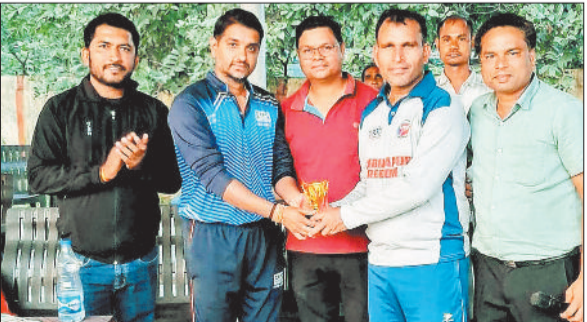
विजेता खिलाड़ी को पुरस्कृत करते अतिथि।

विद्युत पावर क्रिकेट लीग के रोमांचक सफर में 8वां और 9वां मुकाबला खेला गया। जिसमें रायपुर सेंट्रल ने एक ही दिन में दो मैच खेले। दोनों मुकाबलों में टीम को कड़ी चुनौतियों का सामना करना पड़ा। पहले हाफ में खेले गए मुकाबले में रायपुर सेंट्रल ने टॉस जीतकर पहले गेंदबाजी करने का निर्णय लिया। एचटीपीएस कोरबा पश्चिम ने शानदार बल्लेबाजी करते हुए निर्धारित 20 ओवर में 6 विकेट के नुकसान पर 204 रन