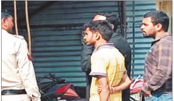
घटना स्थल की जांच करती पुलिस।